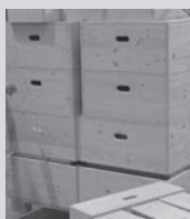
Vereinseigenes Konzertpodium seit 2004

Vor den Sommerkonzerten werden der Garten, Felder und Wegränder durchstöbert und Chormitglieder für Blumenspenden angefragt. Es geht um Blumenschmuck für die schöne Klosterkirche Kappel. Trotz Hagelschäden und Blütenflaute kommt jedes Jahr eine bunte Mischung zusammen. Was ich daran besonders schätze, ist die Zusammenarbeit mit Gleichgesinnten, sei es um schöne Sträuße zu komponieren oder eine Gelegenheit in fremde Gärten hineinzuschauen.